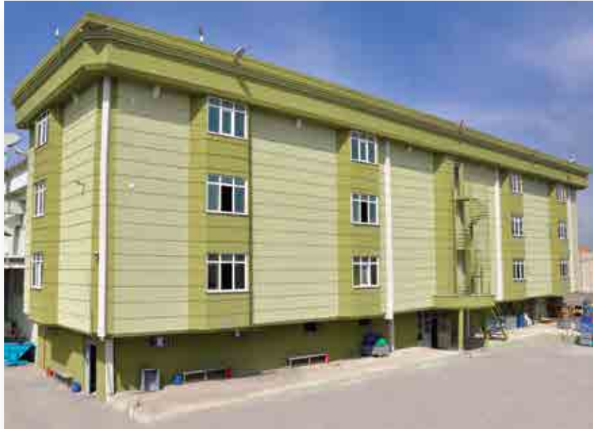
Fabrika 2 / Plant 2