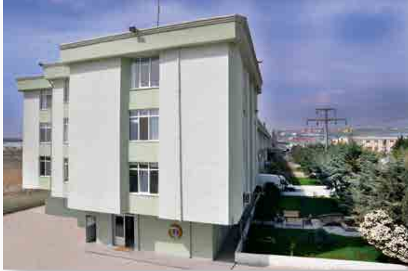
Fabrika 1 & Yönetim Binası / Plant 1 & Headquarter