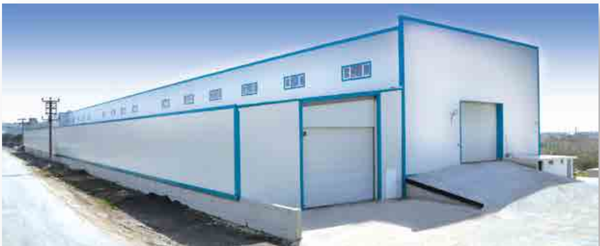
Fabrika 3 / Plant 3